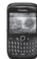
Blackberry 8520 SPECIAL PRICE

Sales, repair and accessories for all blackberry models and other cellular. Unlocked, reload, reset, upgrade, replace lcd, keypad, speaker etc... Also repairs of iphone, Nintendo ds, Play station, X-box 360, Wii, etc